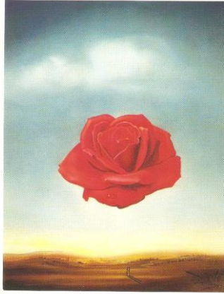
“Συλλογισμένο φραντάφυλλο” Salvador Dalí

· Η ζωή δεν μετριέται από τον αριθμό των αναπνοών που πέρνομε, αλλά από τις στιγμές που μας κόβουν την ανάσα.